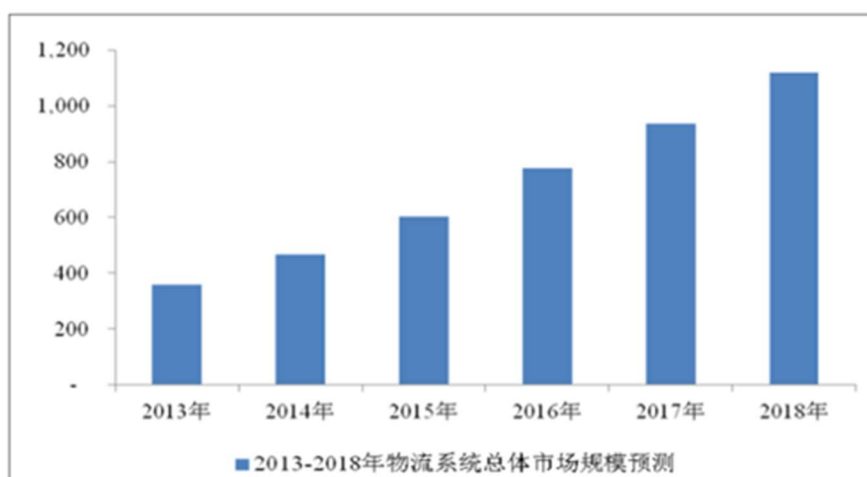
中国智能物流系统市场规模及发展趋势预测 (亿元)

目前主流的拣货技术包括信息显示技术、货物识别技术、机械搬运和取放技术、智能定位与导航技术等。