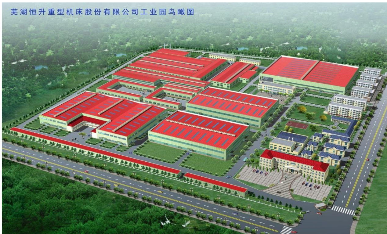
芜湖恒升重型机床股份有限公司工业园鸟瞰图

WUHU HENGSHENG HEAVY MACHINE TOOL CO.LTD.