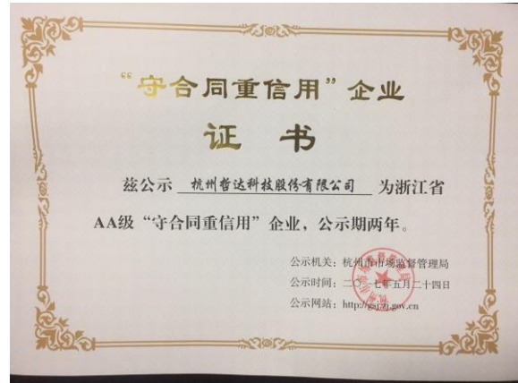
公司被评为浙江省 AA 级“守合同重信用”企业。