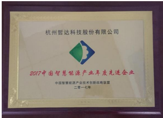
公司获评为“2017 中国智慧能源产业年度先进企业”。