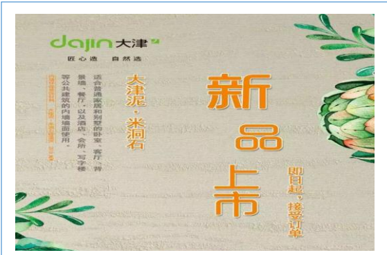
3月 天津米洞石产品上市