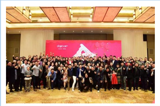
1月 经销商年终总结会