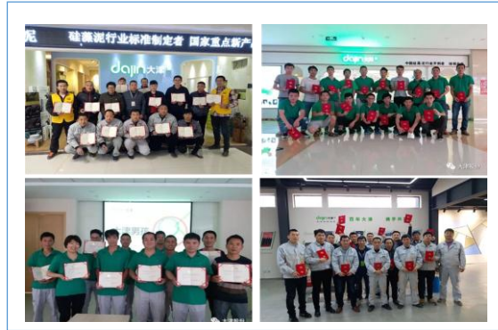
3-6月 硅藻泥施工培训