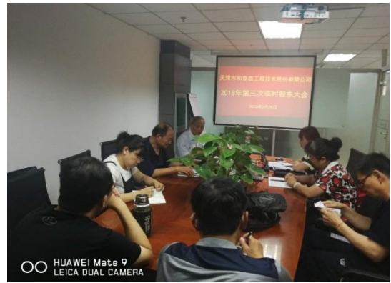
2018 年 6 月 26 日，公司召开第三次临时股东大会，顺利完成第一届董/监/高的换届选举事宜（公告编号：2018-041）。