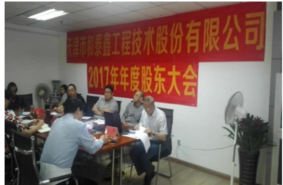
公司顺利召开 2017 年年度股东大会