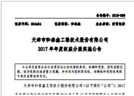
2018 年 6 月 22 日，公司发布 2017 年年度权益分派实施公告，公司股东分享到企业经营成果（公告编号：2018-039）。