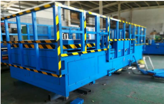
公司为客户开发专利设备：重载 180 度翻转机。