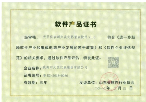
获得软件产品证书(天罡仪表超声波式热量表软件)