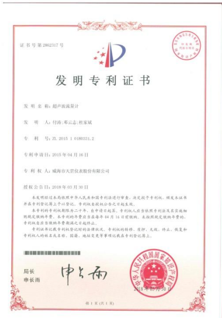
获得发明专利（超声波流量计）。