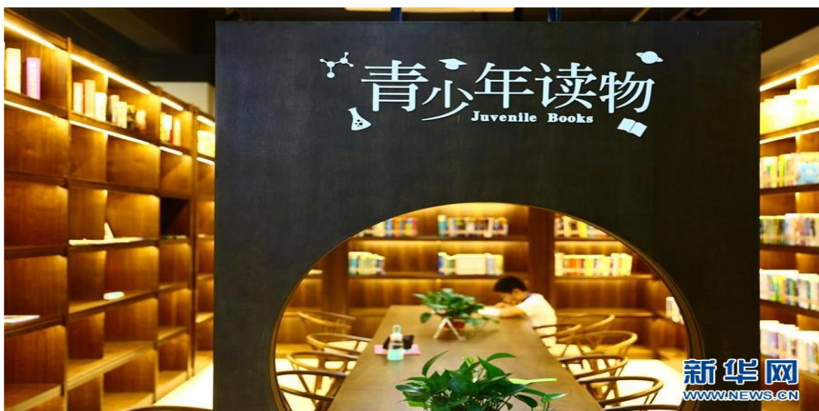
7月18日，在安徽合肥市阅读空间青秀书城内，一名小学生在阅读书籍。

新华网对我司运营的青秀书城公共阅读空间给出高度意见报道。2018 年随着公共图书馆运营服务外包模式越来越成熟，公司运营的线下空间陆续各大平台网站及报刊进行采访报道。由公司在全国首创的公共图书馆运营服务外包“悦·书房”模式，得到了政府及社会各界的高度认可，2018 年公共图书馆运营服务外包业务取得了突破性增长！未来将以标准化线上平台+线下运营方案对全国各地的公共场馆进行整体运营服务业务的发展。