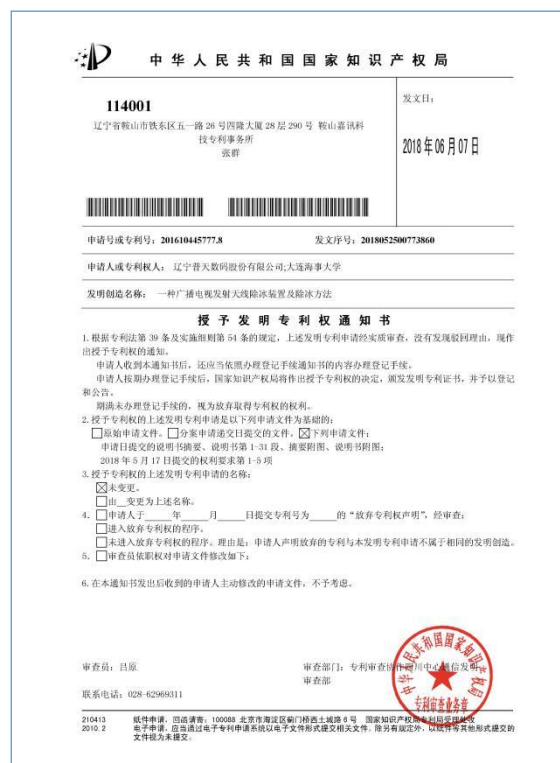
获得一项名为“一种广播电视发射天线除冰装置及除冰方法”的发明专利授权