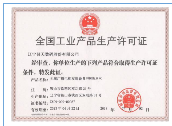
完成生产许可证产品增项