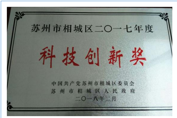
2018年2月份获相城区科技创新奖