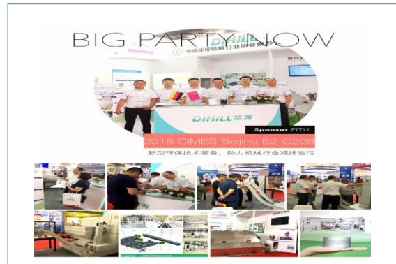
2018年6月26日至30日，参加CIMEST2018第十四届中国国际机床工具展览会