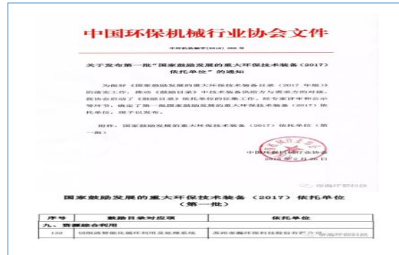
2018年2月成为被列入“国家鼓励发展的重大环保技术装备”推荐目录中“切削液智能化循环利用及处理系统”的依托单位