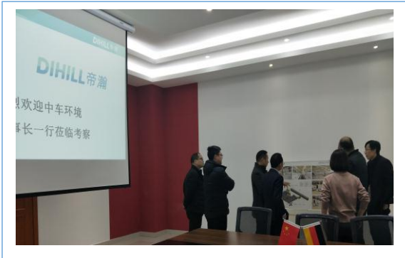
2018年1月12日中车集团领导到我公司莅临视察