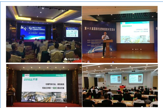
2018年上半年参加苏州、上海、广东、北京等地各种论坛演讲